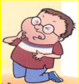
Compresión en el pecho